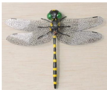
完成したオニヤンマのフィギュア

少しばかり動きがあった方が良さだろうということで一つは身に着ける。もう一つは周囲に吊るして風などで動く状態にすることにした。