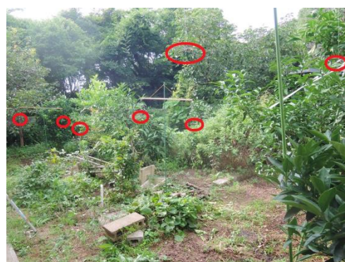
フィールドの様子 赤丸は設置場所 (一ヶ所不明)

複数のフィギュアを使って実証テストを行った。フィールドは我が家の西の空き地柑橘類の植えてあるところで西側と北側はちよとした雑木林状態ということで蚊の天国状態。使ったフィギュアは身に着けて移動するものが6匹、フィールド内に吊り下げ固定した物が8匹合計14匹です。