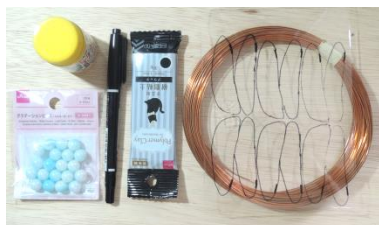
フィギュアに使用した材料

作ったフィギュアをどのような状態で置かか、蚊自体の感覚器官の目はそんなに対象物をはっきり認識できないということでどうやら静置した状態より